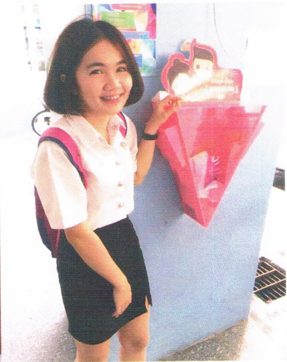
อาคาร ๗ คณะวิทยาการ