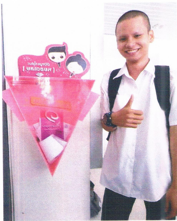
อาคาร ๙ คณะวิทยาศาสตร์