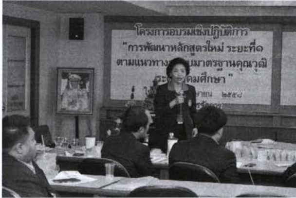
วิทยากรบรรยาย