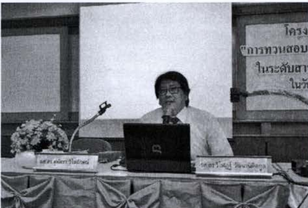
วิทยากรบรรยาย