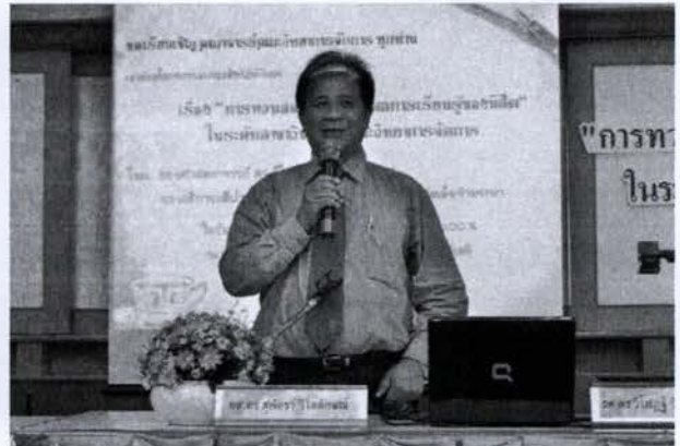
ประธานกล่าวพิธีเปิดโครงการ