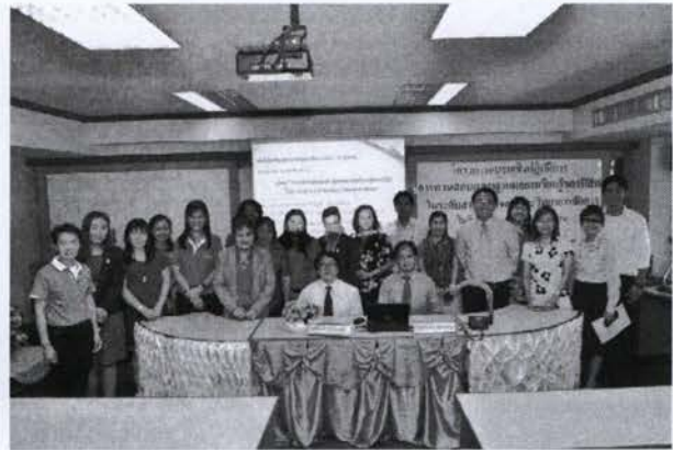
บรรยากาศการอบรม