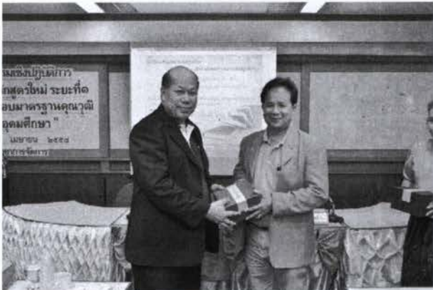
พิธีมอบของที่ระลึก