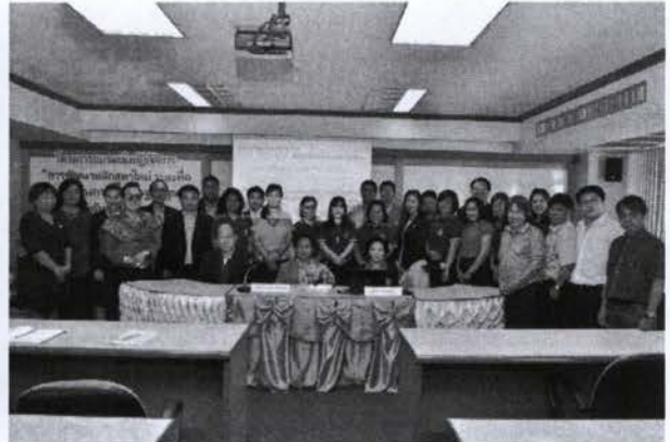
ถ่ายภาพร่วมกับผู้เข้าโครงการ