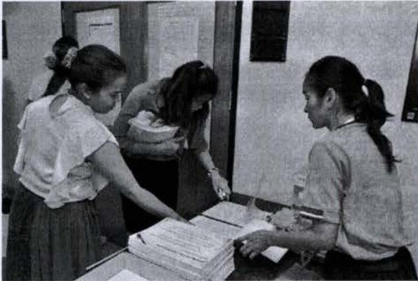
ลงทะเบียนเข้าร่วมโครงการ