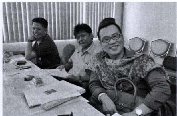
บรรยายภาคการอบรม