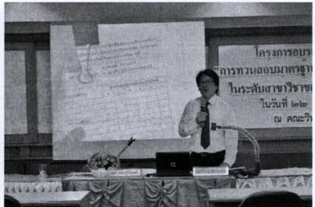
วิทยากรบรรยาย