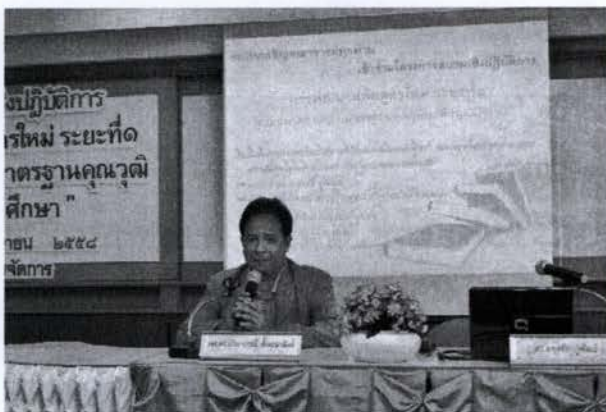
ประธานกล่าวพิธีเปิดโครงการ