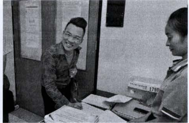
ลงทะเบียนเข้าร่วมโครงการ