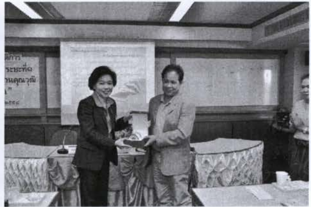
พิธีมอบของที่ระลึก