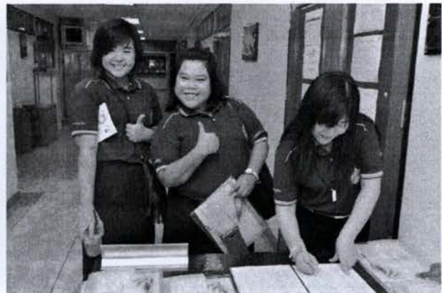
ลงทะเบียนเข้าร่วมโครงการ