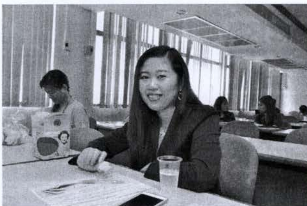
บรรยายภาคการอบรม