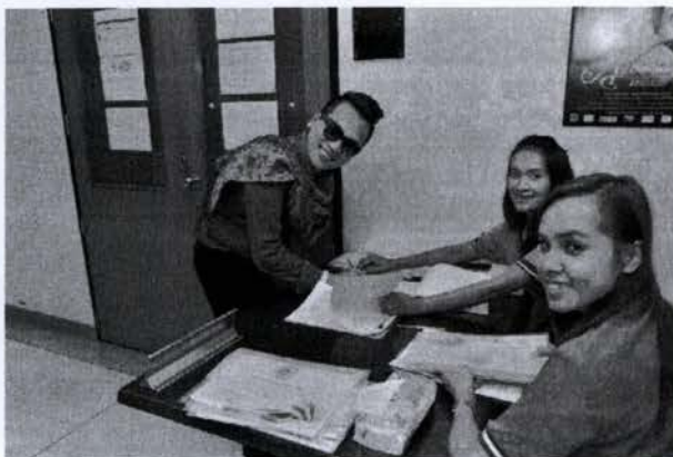
ลงทะเบียนเข้าร่วมโครงการ