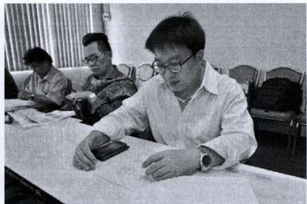
บรรยายภาคการอบรม