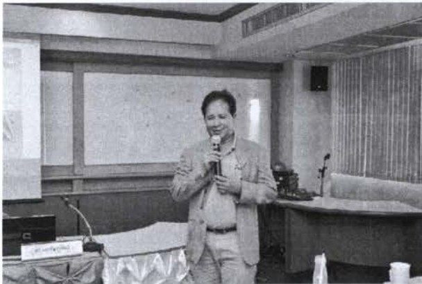
ประธานกล่าวพิธีปิดโครงการ