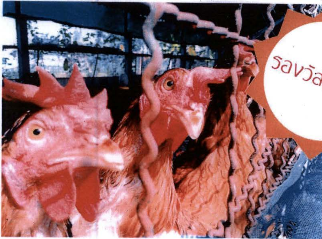
ชื่อภาพ “ไก่จ๋า ได้ยินไหมว่าเสียงใคร”

โครงการอันเนื่องมาจากพระราชดำริเศรษฐกิจพอเพียง “ผู้นำเยาวชน เรียนรู้สืบสานพระราชดำริ” รุ่นที่ ๑